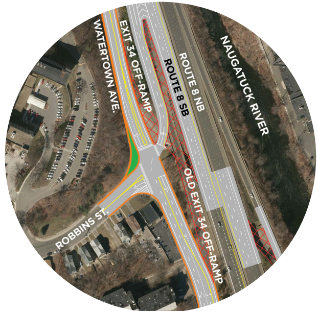
Rampa de salida trasladada a Robbins Street